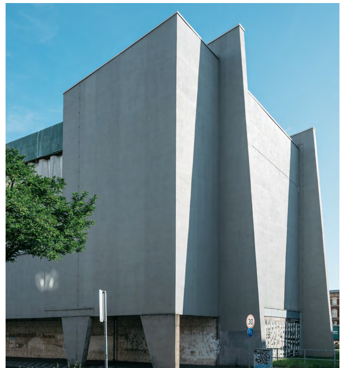
Kulturkirche Liebfrauen, Duisburg

In der Kulturkirche Liebfrauen finden sich noch Räume, die für Gottesdienste genutzt werden, die Oberkirche ist hingegen in ein Kunst- und Kulturzentrum umgewandelt worden,