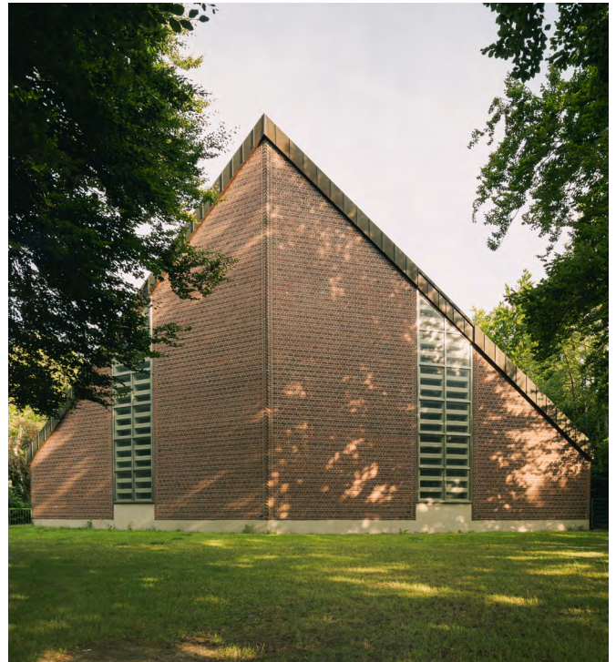
St. Ludgerus, Bochum © Anton Vichrov

Die St. Ludgerus-Kirche (1966 Entwurf von Hans Joachim Lohmeyer) im Herzen von Bochum ist ein Zeugnis der Resilienz und der architektonischen Innovation der Nachkriegszeit. Die außergewöhnliche dreieckige Form, die klaren Linien und die markanten geometrischen Proportionen sind ausgesprochen charakteristisch für die moderne Kirchenarchitektur und bringen überdies die sakrale Bestimmung des Baus auf würdevolle Weise zum Ausdruck.