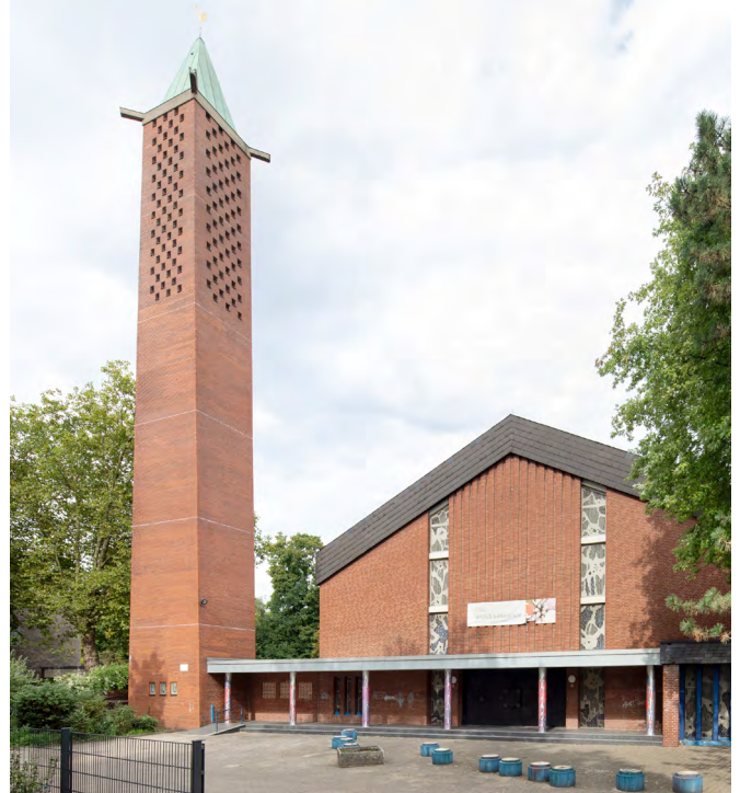
St. Anna, Gelsenkirchen

Seit der Schließung 2007 hat die Kirche eine neue Bestimmung gefunden: das Sozialwerk St. Georg hat das Gebäude übernommen und es als inklusiven Begegnungsort neu definiert. Hier finden Menschen mit und ohne Unterstützungsbedarf einen Raum für Austausch und Kultur. St. Anna hat sich von einem architektonischen Wahrzeichen zu einem lebendigen Ort der Begegnung und Solidarität gewandelt — ein gelungenes Beispiel für die erfolgreiche Umnutzung eines Kirchengebäudes zu einem sozialen Treffpunkt.