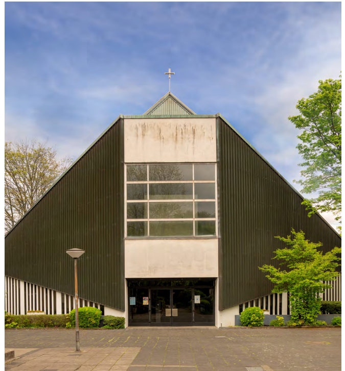
Thomaskirche, Gelsenkirchen

Die Kirche ist von Flachdachgebäuden aus derselben Zeit umgeben, darunter ein benachbarter Kindergarten und ein Gemeindezentrum, die beide eine ähnlich sachliche Architektur aufweisen. Beispielhaft ist die Art und Weise wie die einzelnen Gebäude des Ensembles architektonisch aufeinander abgestimmt und bezogen sind.