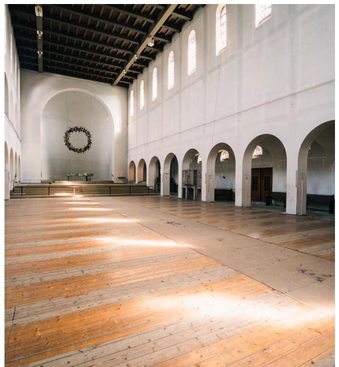
Kunstkirche Christ-König, Bochum