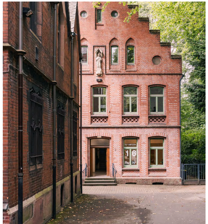
St. Josef, Gelsenkirchen

Unter den Austragungsorten der Manifesta 16 Ruhr nimmt St. Josef (1894–1896 Entwurf von Lambert von Fisenne; die Sakristei wurde 1912 von Josef Franke entworfen) eine Sonderstellung ein. Im Gegensatz zu den ausgewählten modernen Nachkriegskirchen weist sie neogotische und klassizistische Elemente auf. Das seit 2023 geschlossene Pfarrhaus der Kirche dient seit Sommer 2025 als Zentrale der Manifesta 16 Ruhr. In der Kirchenhalle selbst sind vorbiennale Events geplant sowie Höhepunkte des Hauptprogramms der Biennale.