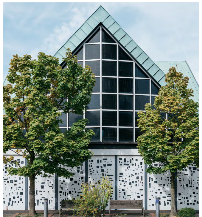
Markuskirche, Essen