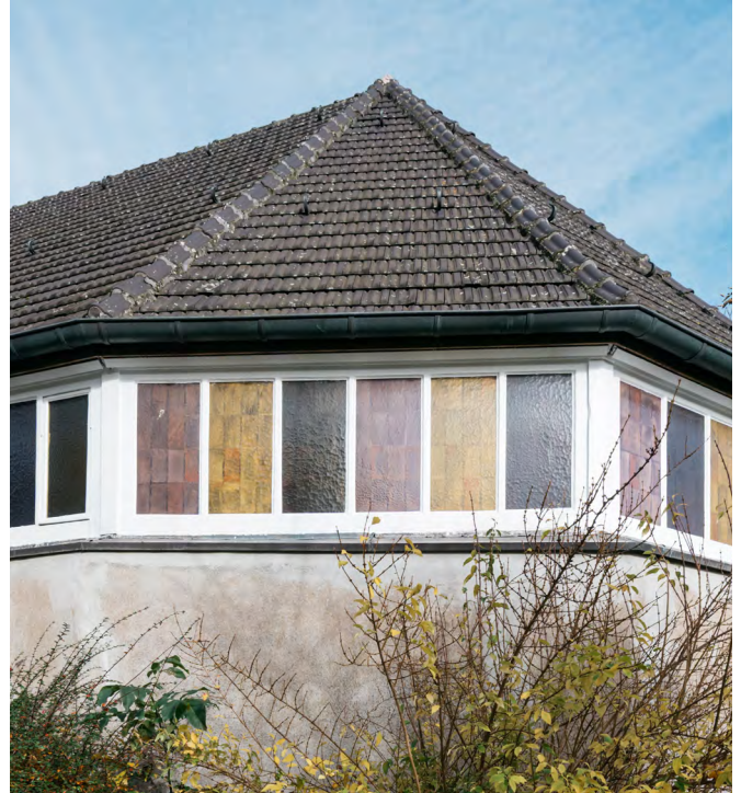
Gethsemane-Kirche, Bochum

Die Christ-König Kirche (1932 Entwurf von Franz Schneider) in Bochum ist die Rekonstruktion einer ursprünglich für das Franziskanerkloster errichteten Kirche. Ihre schlichte Formgebung entspricht dem franziskanischen Ideal der Armut. Nach ihrer Schließung im Jahr 1998 wurde die Kirche während der Feierlichkeiten zur Kulturhauptstadt Europas 2010 als Ausstellungsraum umgenutzt.