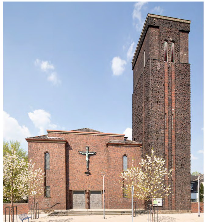
St. Anna, Bochum

Der Kirchenbau von St. Anna (1929 Entwurf von Wilhelm Peter) befindet sich westlich des Zentrums von Bochum inmitten des Stadtteils Goldhamme, der traditionell mit der Stahlindustrie und ihren Arbeiter*innen verbunden ist.